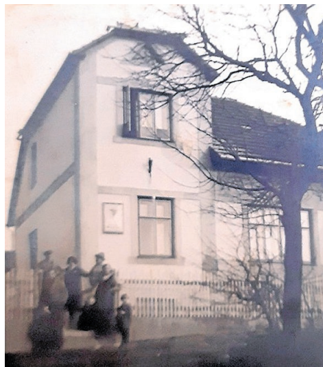
První stavení nového slohu č 76. Postaveno v roce 1933.