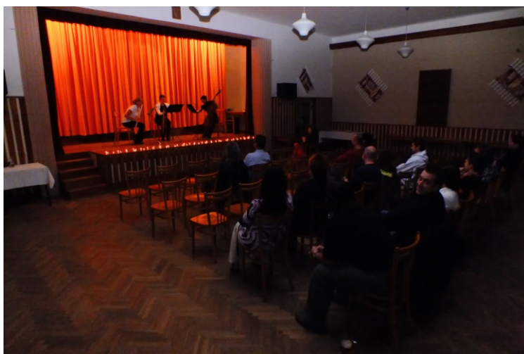
Koncert Dámského tria

10.12. proběhlo tradiční zpívání koled u našeho vánočního stromu, tak u nás po druhé Česko zpívalo koledy. Organizace byla veliká, lidí mraky, chybička se sice zase vloudila, ale to už tak u nás bývá. Tentokrát nás