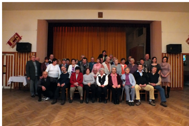
Posezení s důchodci