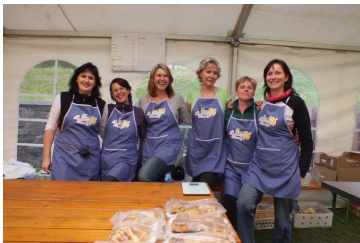
Ženy v akci Zámrsky na hodech