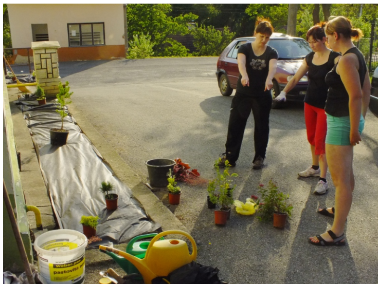
Zkrášlování prostoru před kulturním domem