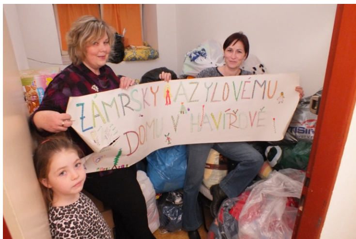
Z předání sbírky v Azylovém domě Armády spásy v Havířově

více informací: http://zenyvakci.zamrsky.cz