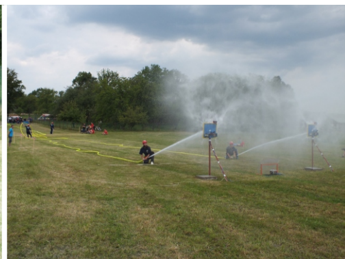
Z loňských závodů v Němeticích