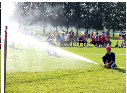
Ze závodů ve Skaličce

školení velitelů, které proběhlo ve dnech 22. a 23.února v Přerově. Pravidelně probíhala kontrola a zkoušení výzbroje a výstroje. Nezanedbávali jsme ani údržbu svěřené techniky, aby byla vždy připravena k zásahu a ochránit tak zdraví a majetek náš a našich spoluobčanů. Vždyť naposledy u nás hořelo 31.prosince, pravděpodobně