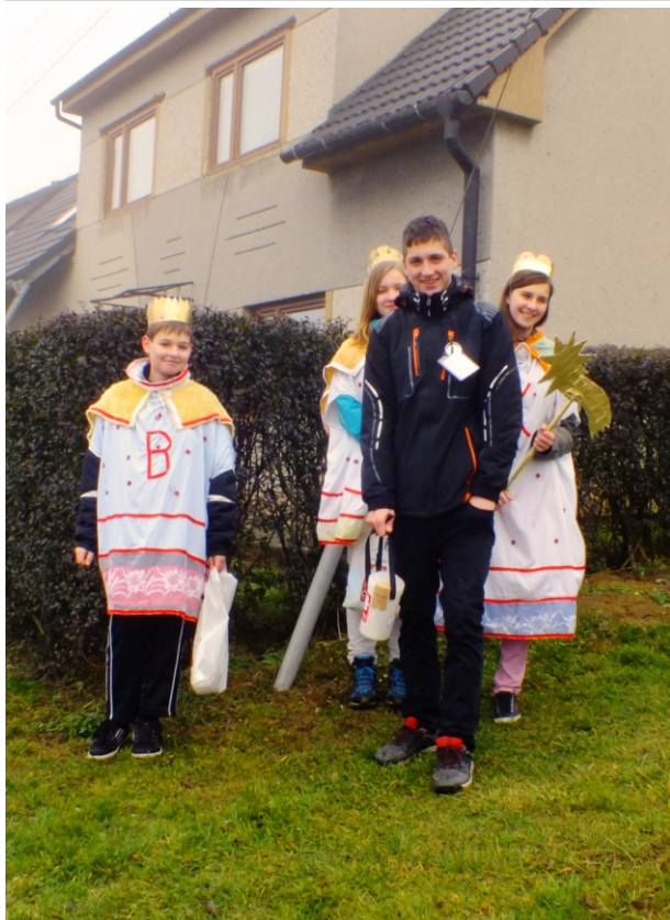
Z Tříkrálové sbírky v roce 2014