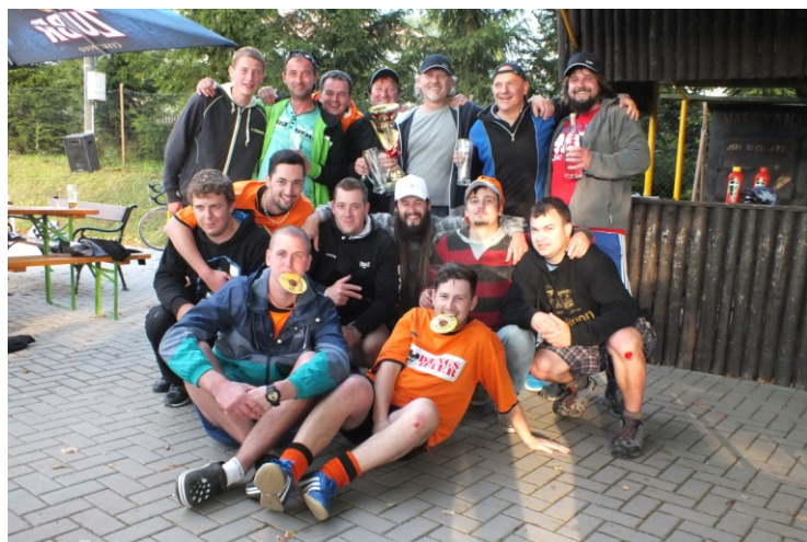
Foto z loňského turnaje v nohejbale