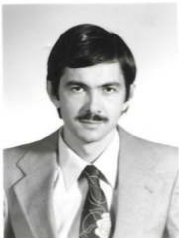
Foto z lágru v Traiskirchenu, když nám vystavovali dočasné dokumenty na pobyt v Rakousku a emigraci do Kanady